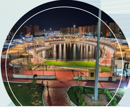
محور المحمودية - الاسكندرية