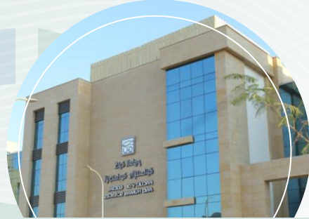
كليات الطب، العلوم الإنسانية و الإعلام بجامعة الجلالة - العين السخنة