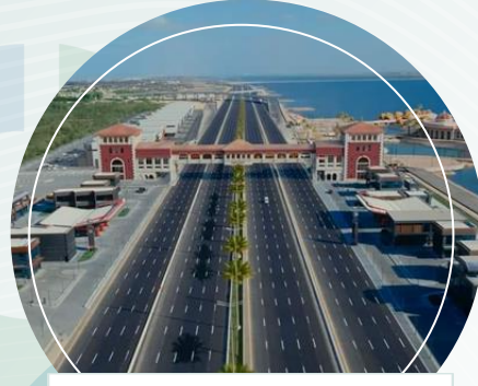
محور التعمير - الاسكندرية