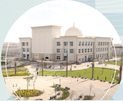
جامعة المنصورة الجديدة - المنصورة