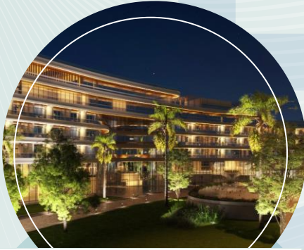
فنادق نازلي وناريمان - الاسكندرية