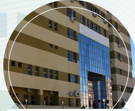
مستشفى أسوان العام