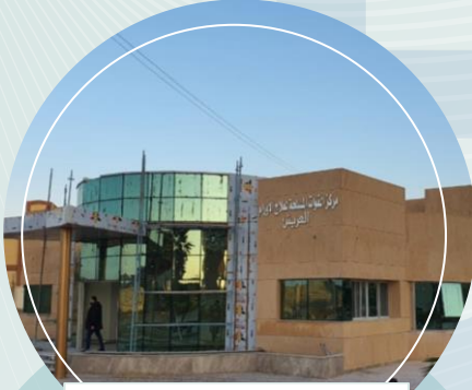
معهد الأورام بالعريش