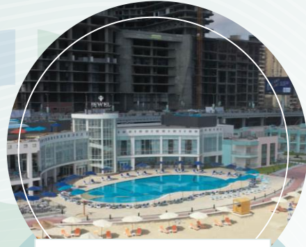
جولدن جويل - الاسكندرية